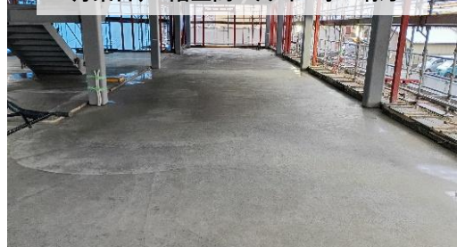
1月某日、1階土間コンクリート工事の様子

▲本社新社屋の建設、順調に進行中 既存社屋の隣地に建替えを行っています (完成予定 2026年5月)