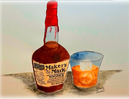
★今月のイラスト 『 ボトルネックの赤い封蝋が好き メーカーズマーク 』