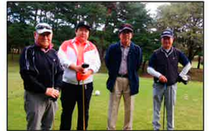
▲ゴルフ大会の様子