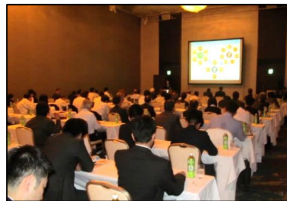
▲昨年、新潟市で開催した会場風景

【ホームページアドレス】 http://www.shigeru-kk.co.jp