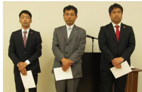
▲3名が、新役職につきました