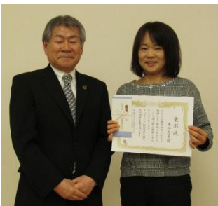
▲10年永年勤続表彰です