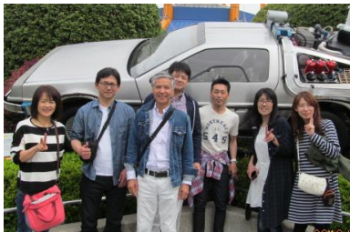
▲USJでバックトゥザフューチャーのアトラクションに乗りました。