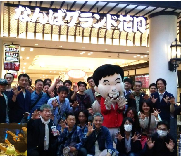
▲なんばグランド花月でハイポーズ