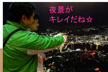
夜景がキレイだね☆

今回の社員旅行は、福岡&長崎の3日間の旅です。大宰府天満宮へ参拝し、柳川でうなぎを堪能、新しく出来た出島表門橋を見学、日本新三大夜景を楽しみ、ハウステンボスで各々が楽しく過ごすことが出来ました。社員の親睦が深まった3日間でした！