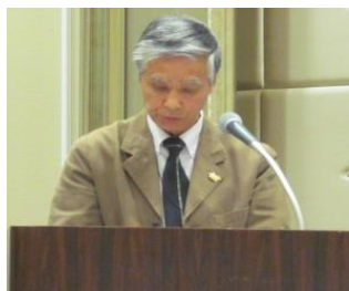
▲各部門ごとの指針表明を発表頂きました。