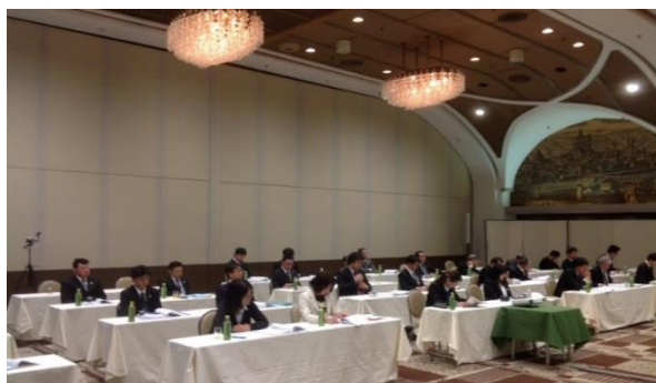
▲シゲルオリジナルシステムの説明をしました。