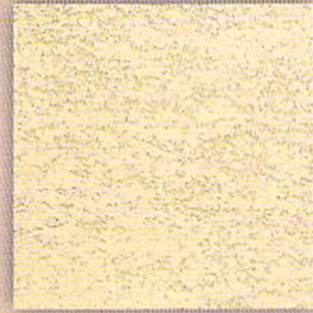
玉石エンシェントブリック