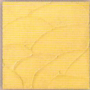
ワイルドランダム