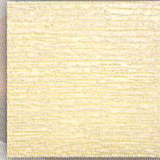
プリュームロッシュ