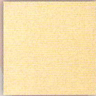
エンシェントブリック